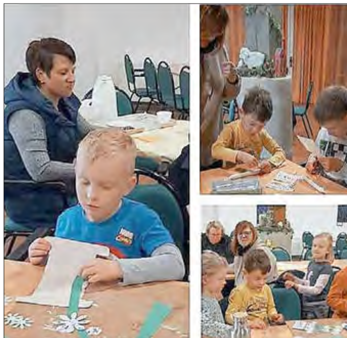
Mit viel Freude und Kreativität entstanden liebevolle Geschenke, die von Herzen kommen.