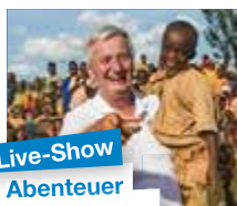
Live-Show Abenteuer Weltumrundung