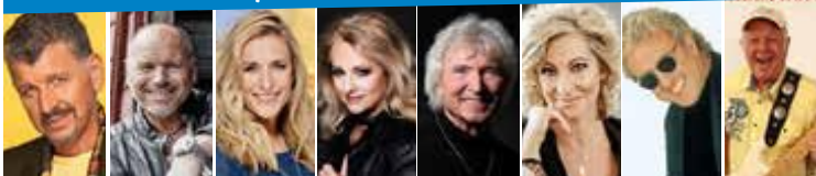
Semino Rossi, Olaf Henning, Stefanie Hertel, Nicole, Peter Orloff, Claudia Jung, Bernie Paul und Graham Bonney

Weitere Infos unter: www.schlager-kanaren.de